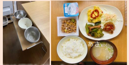
DIYも調理もおてのもの♪

絵の上手な利用者さんがいらしゃるので今後紹介させていただきたいと思っております！お楽しみに♪