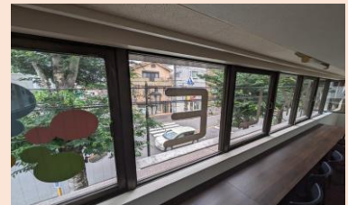
たそがれる用のエモいBGMもご相談ください♪