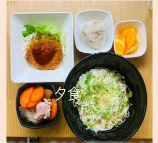
日々のごはんが好評です♪