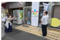
うかれるスタッフ♪

TOKYO8 54くるめら (85.4MHz) 東久留米市・小平市・清瀬市3市の 地域コミュニティラジオ局